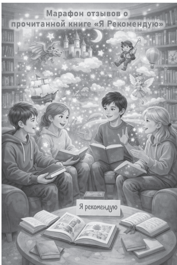
Марафон отзывов о прочитанной книге «Я рекомендую»

- Для развития кругозора. Мы предлагаем участникам ознакомиться с лучшими детскими книгами и рас-